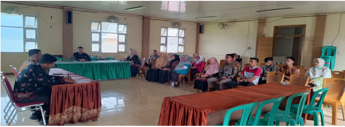
Program Pemberdayaan Masyarakat Desa dan Kelurahan