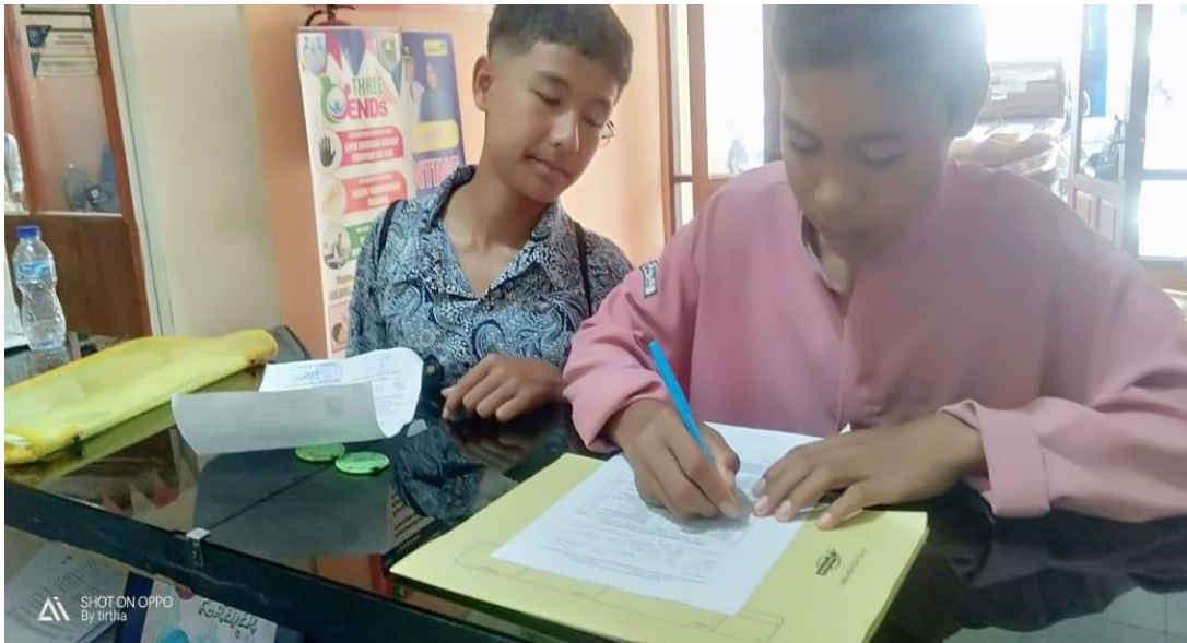
Dokumentasi pelayanan kepada Masyarakat serat pengisian kuesioner

Adapun dalam Upaya pencapaian Nilai IKM didukung oleh dukungan anggaran dengan program kegiatan sebagai berikut :