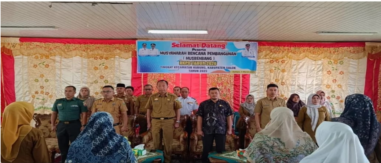
Program Koordinasi Ketemtraman dan Ketertiban Umum